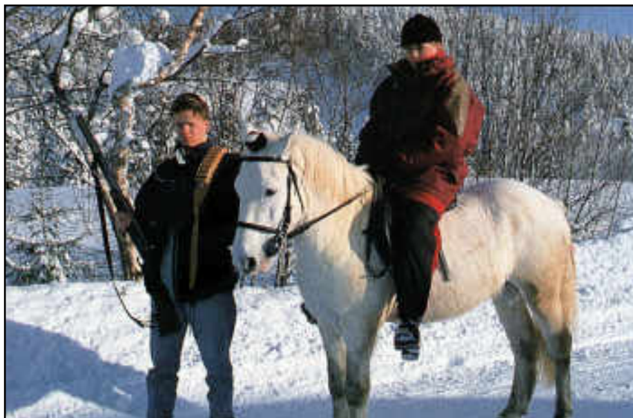
Jenter rir, og gutter jakter og fisker, men NINA-undersøkelsen viser at like mange gutter som jenter ønsker å ri, og like mange jenter som gutter ønsker å drive jakt og fiske!

Resultatene vi har funnet her må sees i lys av dette, og noen av forskjellene vi har observert, kan trolig også forklares ut fra endrede interesser, som for eksempel økning i kino/teater-besøk og besøk på fritidsklubber/ungdomsklubber med stigende alder.